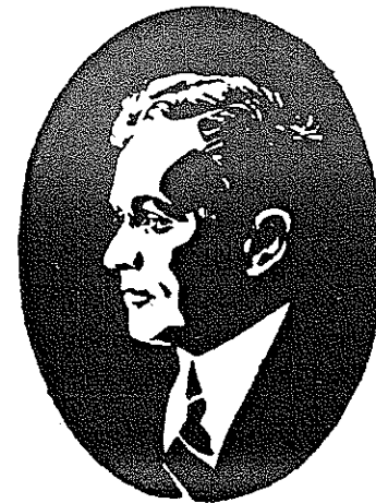
Rok 1917

Husova tř. 70. Tel. 704/V. Program od 14.—20. září: Miláček Maharadžův Orient. drama o 4 dílech.